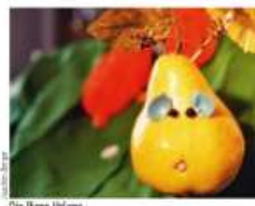
Die Birne Helene

15.30 Großer Saal Ab 4 Jahren Die Birne Helene Ein fruchtiges Figurenspiel mit frisch gepresster Live-Musik Ideen und Spiel: Natascha Gundacker Inszenierung und Musik: Joachim Berger