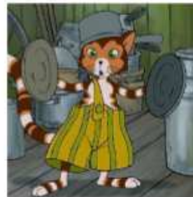
Morgen, Findus, wird's was geben

16.30 Kleiner Saal Ab 5 Jahren Zeichentrickfilm Morgen, Findus, wird's was geben Findus' größter Wunsch ist eine Begegnung mit dem Weihnachtsmann, aber den gibt's doch nicht? Regie: J. Lerdam und A. Sorensen Nach den Geschichten von Sven Nordqvist BRD/Schweden/Dänemark 2005, 73 Min.