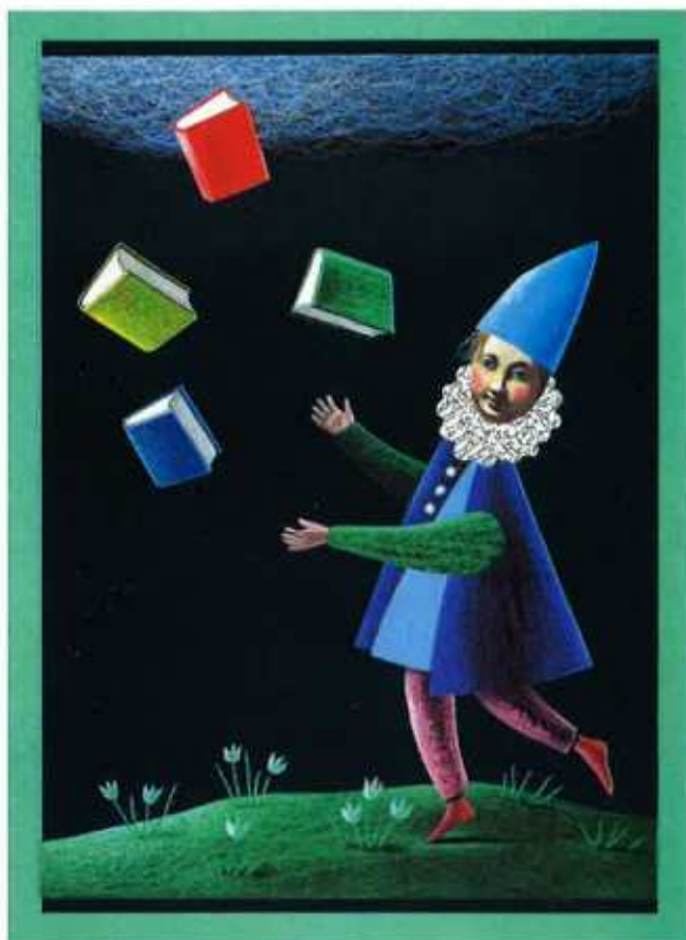
Illustration: Binette Schroeder